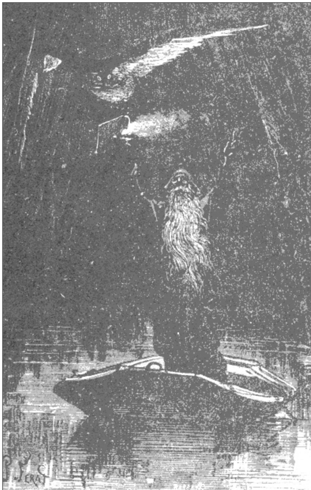
Figure 3. Silfax

27 Le renouveau de la mine d'Aberfoyle permet à Jules Verne de raviver à son tour la puissance poétique de l'emblématique pays de Rob Roy et d'affirmer avec Nodier que la littérature ne meurt pas :