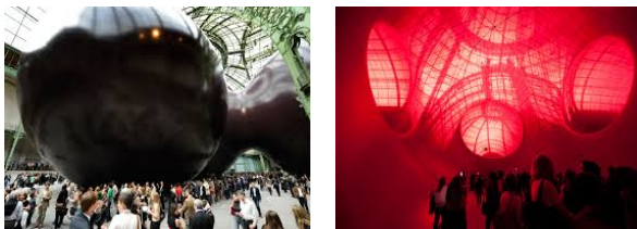
Photos 1 et 2 : "Le Leviathan" de Kapoor (2011) vu de l'extérieur et de l'intérieur.

Un autre fait intéressant semble émerger de l'étude réalisée à la RMN-Grand Palais avec l'exposition Monumenta. Sa particularité tient au fait qu'elle présente une oeuvre unique, et non un ensemble d'oeuvres présentées dans plusieurs espaces. Et cette sculpture monumentale de Kapoor propose une immersion totale pour les visiteurs qui la visitent de l'intérieur (Cf. Photos 1 et 2). Plonger dans cette sculpture invite davantage à l'émergence du ressenti, d'impressions et de sensations. Ces deux éléments associés font en sorte de transformer l'activité de visite à la fois chez les visiteurs et les médiateurs : un temps de visite plus long et qualitatif est alloué à une seule et unique oeuvre.