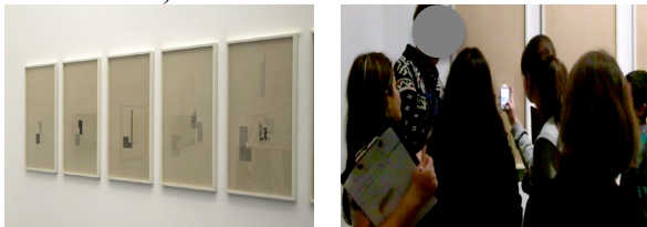
Photos 3 et 4 : "Prelude" de Richter (1919) à gauche, prise de photos des oeuvres par l'adolescente à droite.

sociaux. Elles permettent aussi de garder en réserve un maximum d'oeuvres pour se laisser le temps d'en choisir une ultérieurement en vue du projet. Enfin, ces prises de photos et de vidéos peuvent être utilisées comme instruments de prise de distance et de transformation de l'oeuvre lorsqu'il s'agit de voir de près ou autrement certains effets et procédés techniques. Par exemple, une adolescente a pris en photo un lot de 11 peintures représentant des formes géométriques qui évoluent chronologiquement (Cf. Photos 3 et 4).