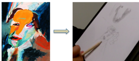
Photos 5 et 6 : "Portrait visionnaire" de Richter (1917) à gauche, un croquis de l'oeuvre réalisé à droite

Elle a décidé de garder ce type de traces dans l'optique de reprendre ces photos ultérieurement et d'accélérer leur visionnage pour esquisser et provoquer un mouvement dans ces oeuvres qu'elle ne voyait pas au départ : « j'ai repris chez moi les photos et les passe toutes vite (...) ça marchait pas trop vite mais j'ai revu après le mouvement un petit peu, pas beaucoup ». Durant la visite, le jeune public va également alterner entre des périodes d'écoute du médiateur et de compréhension de son discours avec des moments d'incompréhension et de décrochage . Ces derniers adviennent lorsque le médiateur aborde des courants artistiques et des contextes historiques jugés difficiles d'accès pour les jeunes visiteurs qui n'osaient pas questionner le médiateur : « à ce moment là le dadaïsme j'étais un petit peu perdu hein (...) on se posait des questions, ça veut dire quoi le dadaïsme... je me suis dit j'ai peut être pas écouté, il a peut être dit la réponse ». Par la suite, les adolescents ont grandement apprécié les anecdotes énoncées par le médiateur (ex : un artiste qui se pose comme contrainte de dessiner dans l'obscurité) ainsi que les jeux et l'invitation à réaliser le croquis d'une oeuvre ou d'un camarade les yeux fermés juste après (Cf. Photos 5 et 6).