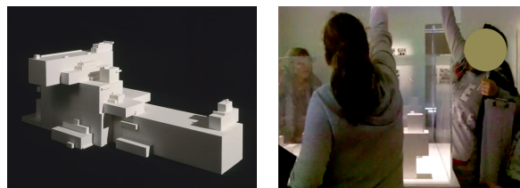
Photos 7 et 8 : "Alpha" de Malevitch (1923) à gauche, prise de photos en hauteur de l'oeuvre à droite.

trucs qu'on connaît pas (...) je me suis dit que c'était cool » . Cette visite nous apprend également que les échanges entre adolescents sont importants durant cette activité, ils permettront de comparer ou échanger des notes sur le discours du guide, de s'appuyer sur un camarade pour qu'il prenne la photo d'une oeuvre souhaitée ou d'échanger sur des éléments non compris. À un moment de la visite, des adolescentes vont s'entraider pour réaliser une photo avec un angle bien précis d'une oeuvre en hauteur et échanger sur la bonne réalisation de la prise : « j'ai quand même réussi à prendre toute l'oeuvre, j'ai tout bien fait (...) j'ai montré à R. et M. (...) elles m'ont demandé comment j'ai pris une photo du dessus, c'était pas facile. Il y avait C. qui essayait mais elle n'y arrivait pas » (Cf. Photos 7 et 8).