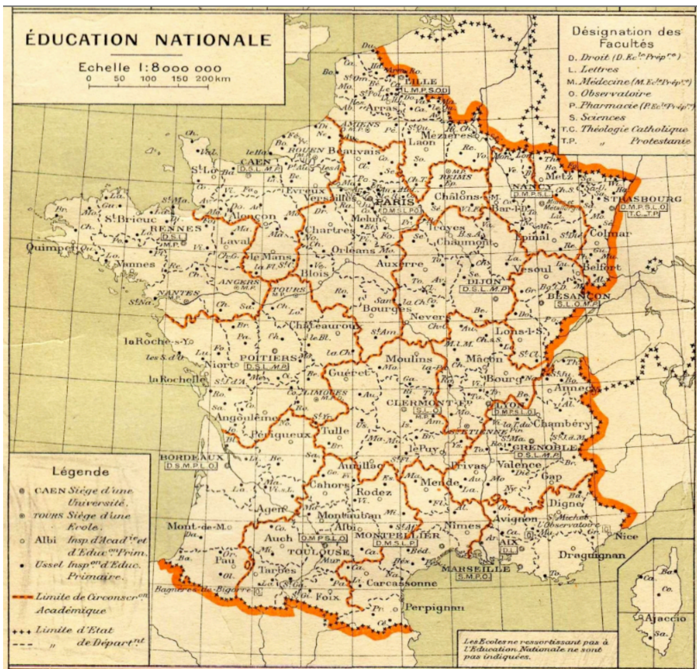
Planche n°70, 1 : 8.000.000°, Société française de cartographie

Atlas de la France, divisions administratives, 1956