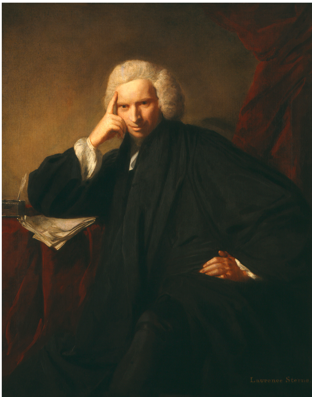
Figure 1 : Sir Joshua Reynolds, Laurence Sterne , 1760, huile sur toile, 127,3 cm x 100,3 cm, National Portrait Gallery, reproduit avec l'aimable autorisation de la National Portrait Gallery de Londres.

entre autres à Robert Burton, qui l'adopte pour le frontispice de son Anatomy of Melancholy (1621) que Sterne cite à plusieurs reprises dans son œuvre.