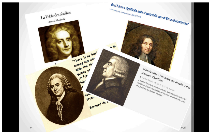
Figure 4 : captures d'écran de quelques résultats d'une recherche « Bernard Mandeville » sur Google Image, recherche effectuée le 8 décembre 2018, image réalisée par Sylvie Kleiman-Lafon.