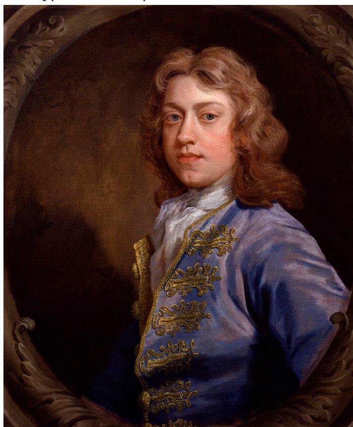
Figure 5 : John Closterman, Unknown Man, formerly known as Sir James Thornhill (Portrait d'un inconnu, anciennement portrait de Sir James Thornhill), v. 1705-1707, huile sur toile, 74,9 cm x 61,6 cm, avec l'aimable autorisation de la National Portrait Gallery.