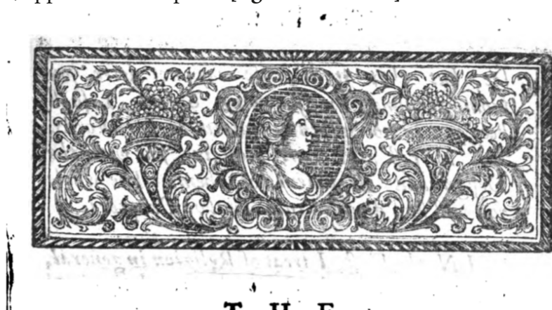
Figure 6.1 : ornement gravé, Bernard Mandeville, Free Thoughts on Religion , London, T. Jauncy, 1720, p. 2, https://fleuron.lib.cam.ac.uk/ornament/026730170000020_1