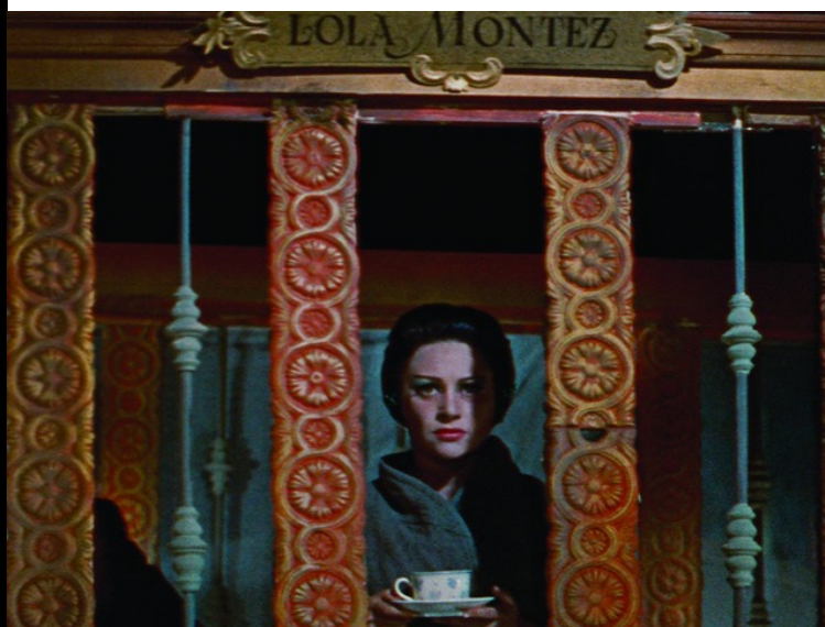
Affiche de Variety (1983) de Bette Gordon // Photogramme de Lola Montès (1955) de Max Ophüls.