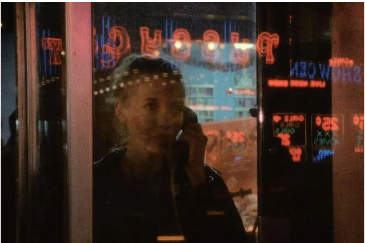
Reflets et lumières de la ville nocturne. Photogramme de Variety (1983) de Bette Gordon.

Revenons à ma première confrontation avec l'affiche du film – objet clairement visuel, fait « pour être vu » : je ne peux m'empêcher de sourire en pensant à l'ironie de son emplacement. À l'entrée du cinéma Louxor, dans le 18 e arrondissement de Paris, cette sorte de cabine ou de guichet présente dans l'image se trouve placée à côté de la vraie billetterie, tous les deux donnant sur l'entrée toujours chaotique de la station de métro Barbès-Rochechouart, dans un quartier aujourd'hui encore considéré comme mal famé, pas loin de Pigalle et de ses sex-shops , peep-shows et cabarets. Ici, partout où je regarde, je cours le risque de voir ou d'entendre des choses qui ne me plaisent pas ; c'est pourquoi j'ai réalisé depuis un moment qu'il vaut mieux traverser la rue les yeux fixés au sol, pour ne les lever qu'une fois devant l'écran de la salle de cinéma. Pourtant, ce soir-là, face à la mise en abîme accidentelle (l'était-elle vraiment ?) de l'affiche magnétique de Variety sur la façade du Louxor, cette femme blonde dans le guichet me semblait être la première à oser dévisager la nuit citadine que l'on sait si hostile aux femmes – ou, transposé dans l'univers du film, le micro-cosmos néo-noir aux alentours de Times Square, à New York, dans le début des années 1980.