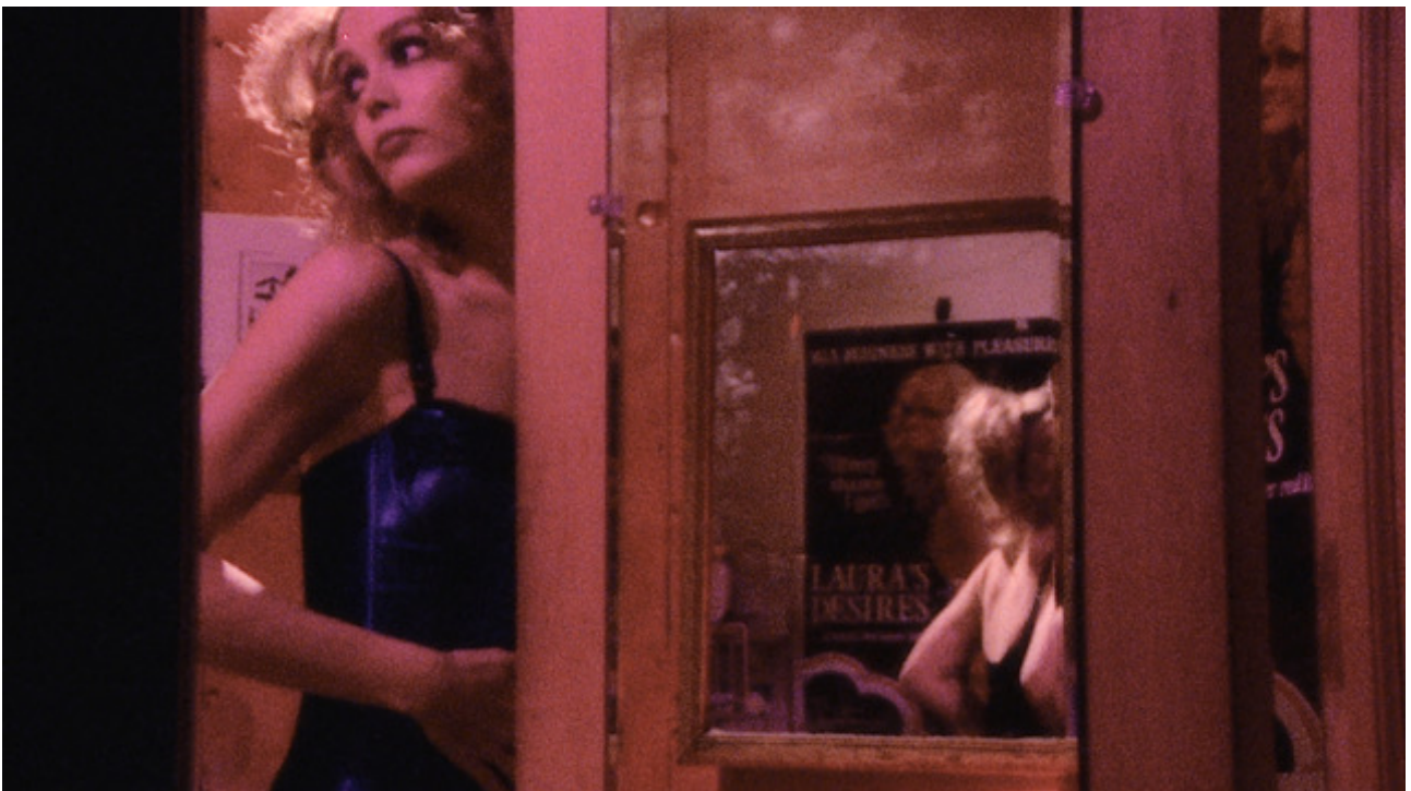
Mise en abîme des désirs du personnage. Photogramme de Variety (1983) de Bette Gordon.