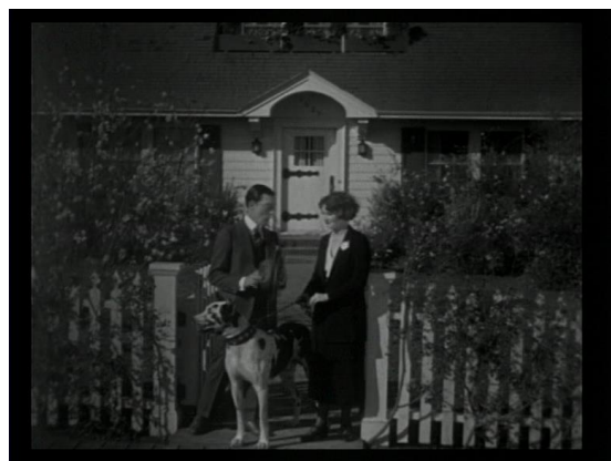
Buster Keaton et Ruth Dwyer dans Seven Chances (été, automne, hiver et printemps)

On connaît la suite : héritier d'une somme fabuleuse à condition de se marier avant la fin de la journée, il court se déclarer auprès d'elle. Timide, il « répète » seul, à plusieurs reprises, sa déclaration, mains sur le cœur et genou à terre. Tout occupé à ses préparatifs, qui consistent à bien placer les jambes et la voix, il ne voit pas venir la jeune fille dans son dos. Ainsi, quand il lance à la cantonade : « Voulez-vous m'épouser ? », il entend un « oui » qui le désarçonne. Passée la surprise, teintée d'incrédulité pour lui, les voilà donc promis l'un à l'autre : ils s'embrassent et s'étreignent, joue contre joue, lui soulagé sans doute que cela soit si simple, elle récompensée de sa patience. C'est à ce moment que les choses se gâtent : il faut aller se marier maintenant, dit-il en regardant sa montre : « Pour hériter, je dois épouser une fille aujourd'hui ». « Peu importe qui, je dois épouser quelqu'un », ajoute-t-il pour se justifier. Ce retour au pragmatique et à la parfaite franchise qui va avec, au beau milieu des effusions, n'est évidemment pas du goût de la promise.