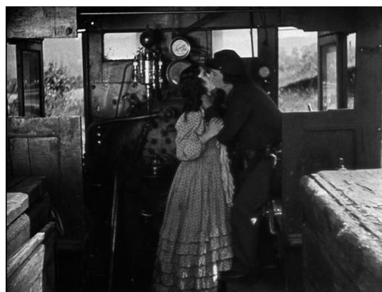
Buster Keaton et Marion Mack dans The General .