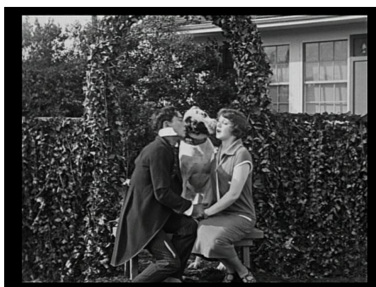
Buster Keaton et Ruth Dwyer dans Seven Chances , image finale du film.