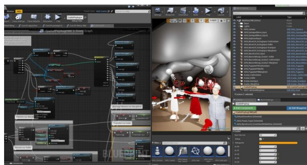
Logiciel Unreal 4: l'éditeur de la cuelist permettant de contrôler les comportements des avatars dans le moteur de jeu Unreal 4.