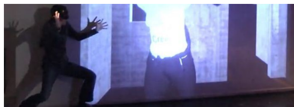
Cluster Workshop CW#3 à l'Université Paris 8: l'acteur masqué improvise avec un avatar masqué piloté par un autre mocapteur . Personne sur la photo : une étudiante du Département théâtre de l'Université Paris 8. Mai 2016.

G. Gagneré : Interdépendance oui, mais il y a peut-être un problème plus large. Pour rendre