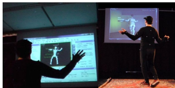
Atelier CRÉATIC à l'Université Paris 8: Motion Retargeting de l'acteur sur un avatar. Personne sur la photo: l'acteur

G. Gagneré : Par exemple, nous avons démarré le projet avec la Kinect 1 en décembre 2015, puis nous sommes seulement passés à la Kinect 2 en mai 2016. Nous n'avions pas pu commencer avec la version Kinect 2, car le plan de travail était complexe et il fallait gérer la combinaison de plusieurs logiciels. La question d'Oculus Rift, c'est un second paradigme qui modifie les points de vue du spectateur et de l'acteur