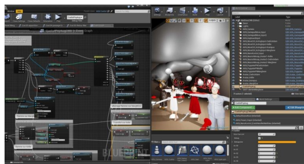
Logiciel Unreal 4: l'éditeur de la cuelist permettant de contrôler les comportements des avatars dans le moteur de jeu Unreal 4.